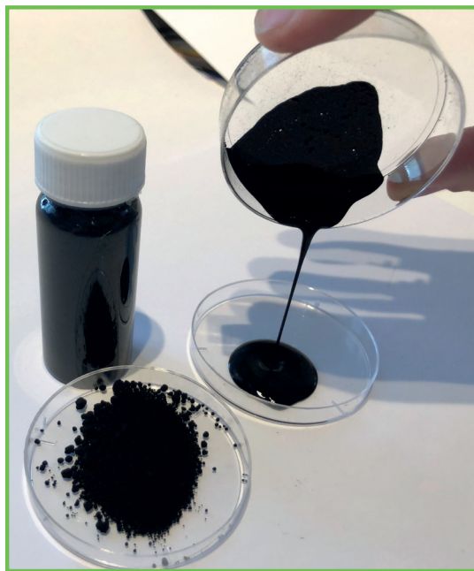
Fig. 1 Dispersion of special carbon black prepared with LigniOx dispersant Dispersione del carbon black speciale preparata con LigniOx

The effect of LigniOx dispersants on zeta potential ( \zeta ) and particle size distribution of CB was measured using Zetasizer Nanoseries S90 (Malvern instrument TM Ltd). Highly diluted dispersions of CB with varying concentration of dispersant